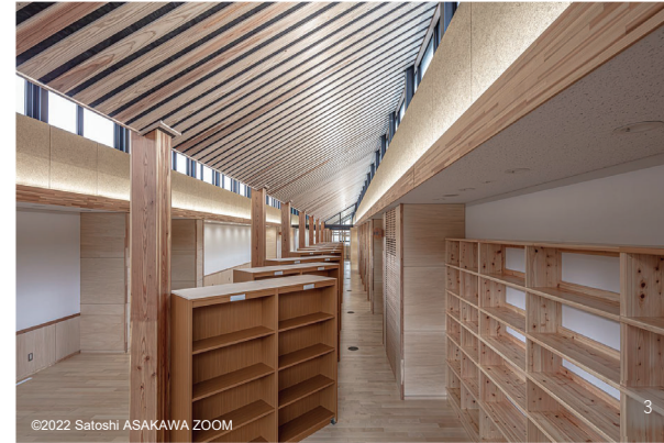
ZOOM 3

「松田と共に育つ 新しい学びの樹」をコンセプトに、在来軸組工法を採用した木造3階建ての準耐火構造の小学校。大空間を実現するために、集成材と製材の最適な組み合わせを検証しつつ、費用対効果も追及しました。