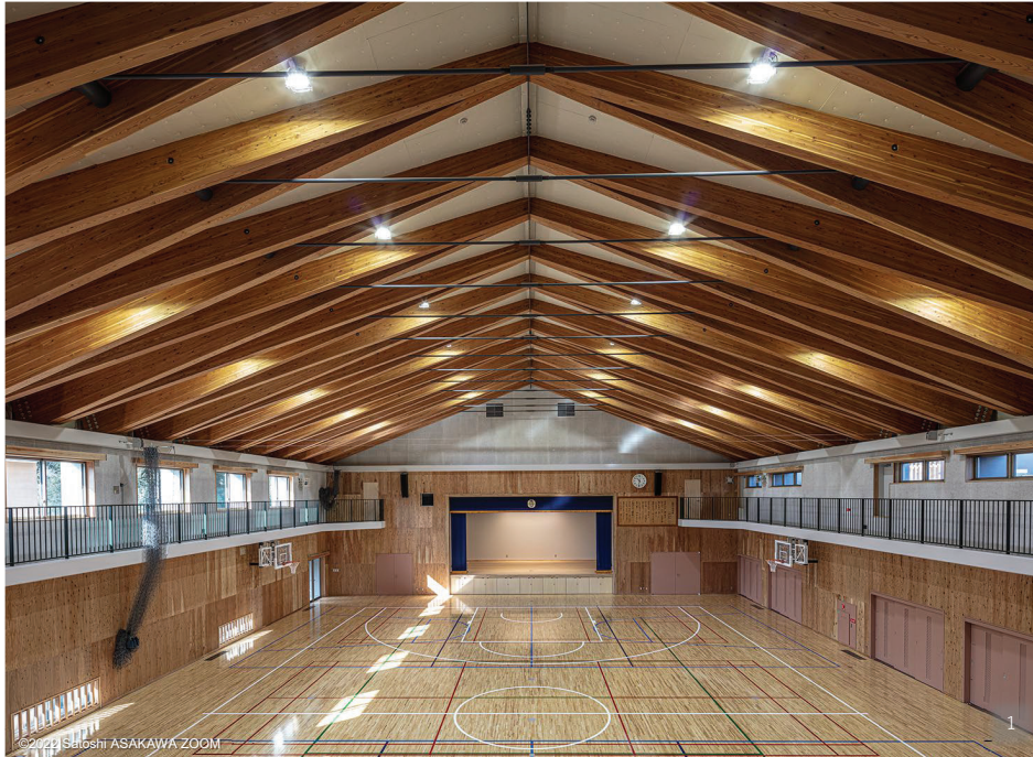
ZOOM 1