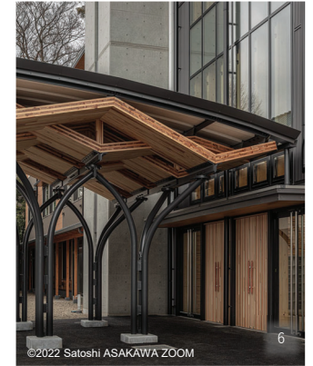
ZOOM 6