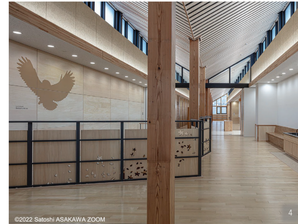
ZOOM 4