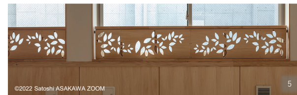
ZOOM 5